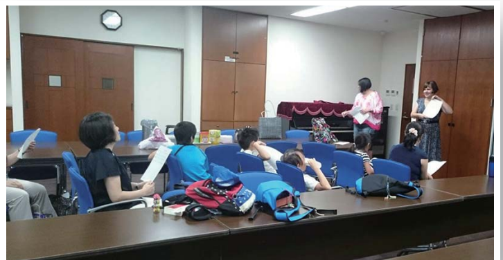
東京教会『英語の子ども賛美歌』学び

東京教会のこども礼拝は、9:30の牧師先生のお話しと聖餐式(第1)に与る礼拝に引き続き、3クラスの分級と「英語の讃美歌を教わる日(第4)写真」を中心に、常時6人程、またペンテコステ礼拝の薔薇の花撒き、花の日の東京老人ホーム訪問、夏のキャンプ、敬老の日に因んだ「信仰の先輩に感謝する会」のお祝いのカードの作製、子ども祝福式の参加、子どもクリスマス礼拝のページェントなど行事の時には最大20人くらいのお友達と教師4人が、教育委員会と教会の皆様に支えられて過ごしています。